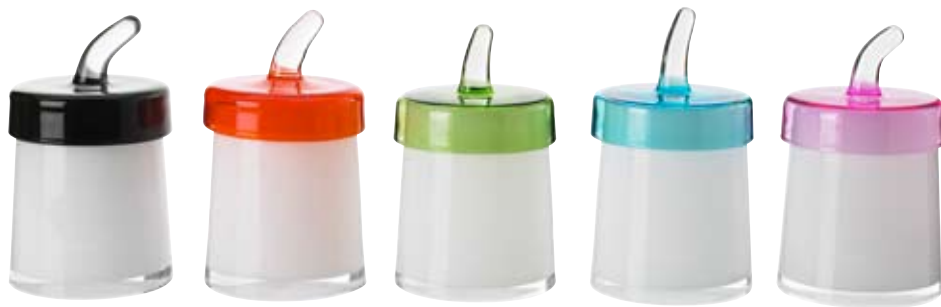
Skleněná dóza Glatt může ukrývat bonbony nebo nejrůznější drobnosti, cena 299 Kč (IKEA)