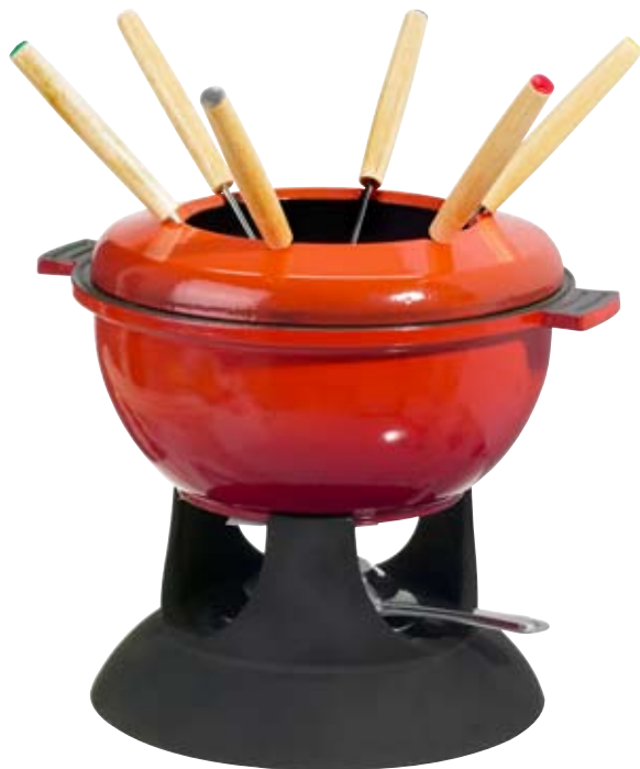
Senior, souprava na fondue v barevné kombinaci červená/černá od designéra Kristiána Krogha, cena 1 190 Kč (IKEA)

1 Pracovní plocha volně přechází v barový pult, jenž opticky odděluje kuchyňský a obývací prostor