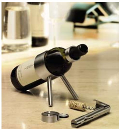
Praktickým pomocníkem pro večerní posezení u dobré sklenky je držák na láhev vína (ABITARE)