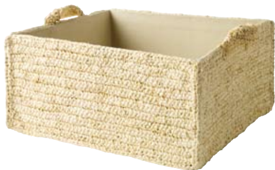
Angelsbo, víceúčelový koš z přírodního materiálu za 399 Kč (IKEA)