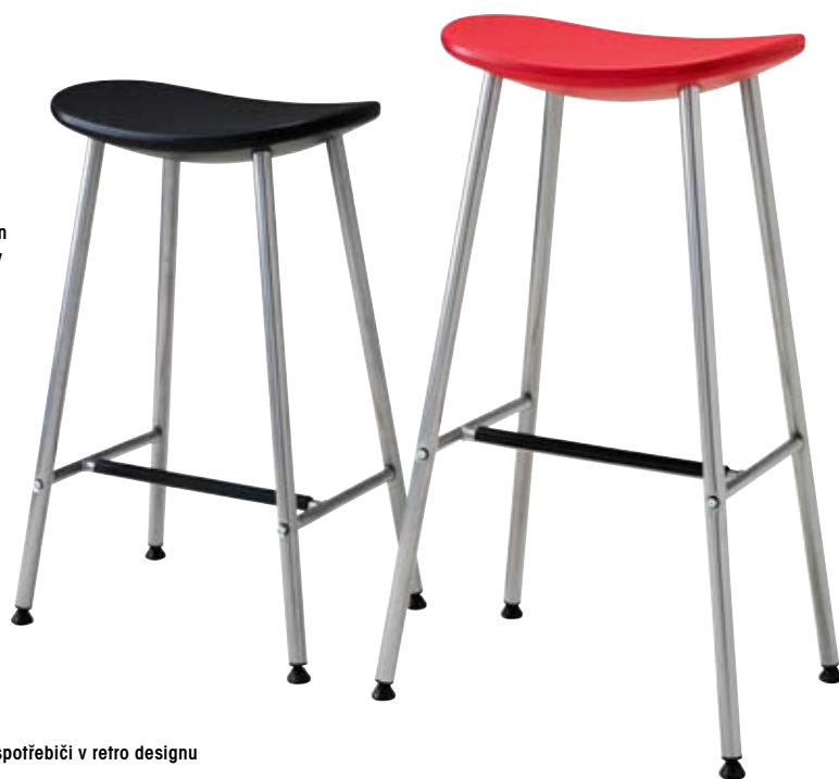
Barové stoličky Sune, design Choris Martin, výška sedáky 63 cm a 74 cm, cena od 399 Kč (IKEA)

5 Varné centrum zařízené spotřebiči v retro designu