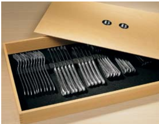
Sada příborů, cena dle typu (HOME STYLE)