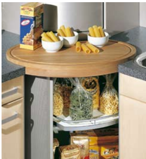
Potravin pro denní použití je dobré mít vždy po ruce (SCHÜLLER)