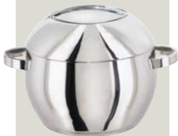
Medalj, hrnc s poklicí z nerezové oceli s objemem 5 l, cena 998 Kč (IKEA)

Pro toto řešení se nejlépe hodí vestavné spotřebiče, zabudované do prostoru skříní naproti pracovní ploše. Mikrovlnná a kombinovaná trouba jsou umístěny nad sebou výše od podlahy z důvodu snazší manipulace a pohodlnějšího přístupu. V levé části stěny je také chladnička s mrazničkou, vpravo pak najdeme vestavný kávovar. V pracovním prostoru nalezneme sklokeramickou varnou desku, v blízkosti mycího centra pod pracovní plochou je zabudována myčka. Cena sestavy bez spotřebičů v provedení lamino a MDF fólie (dvířka) se včetně pracovní desky z materiálu postforming pohybuje kolem 70 000 Kč. Při variantě desky z přírodního kamene však musíme počítat s vyšší cenou.